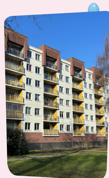
Foto: balkonzijde Beatrixhof 400

We hopen op jouw begrip. Samen zorgen we voor een fijne woonomgeving én helpen we de natuur te beschermen!